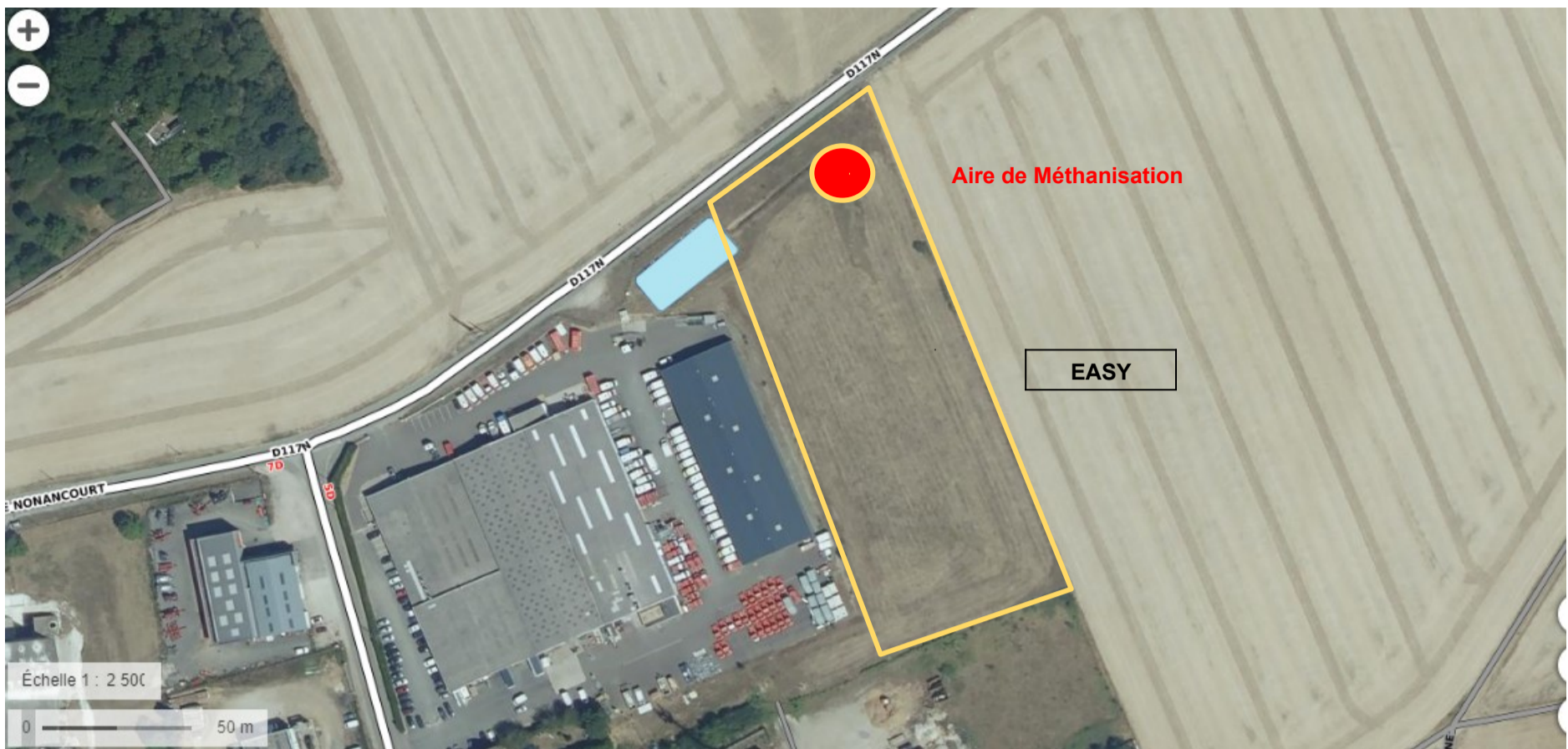
Carte de localisation (échelle : 1/2.500 ème )

Le projet est situé sur la commune de Brezolles à l'Est, localisé au sud de la D117N rue de Nonancourt, et le bois de la friche